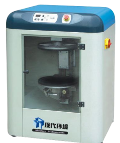
HT-30A全自动旋转混均机