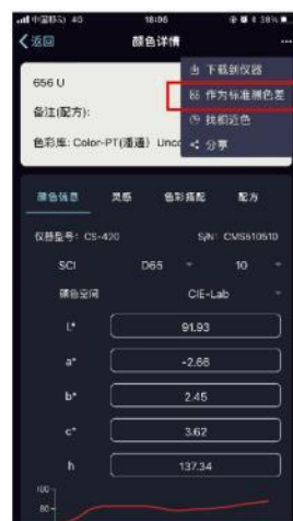
将色卡颜色作为标准