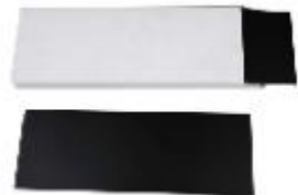
黑色聚烯烃塑料片